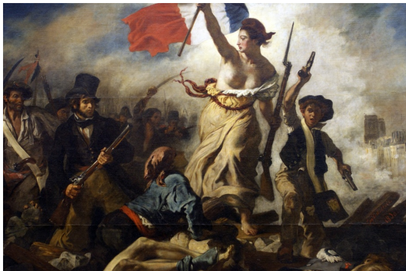
La Liberté guidant le peuple – Eugène Delacroix – 1830 – Musée du Louvre - Paris